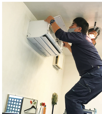
エアコンは業者さんに